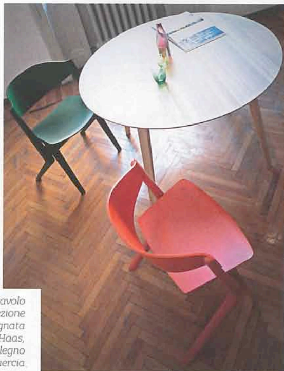
La sedia e il tavolo della collezione Scout disegnata da Christian Haas, prodotta in legno di quercia giapponese da Karimoku New Standard .