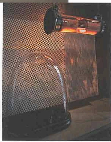
A destra: in mostra da Raw, la collezione di lampade In the Tube disegnata da Dominique Perrault e Gaele Lauriot-Prévost e prodotta da DCW éditions .